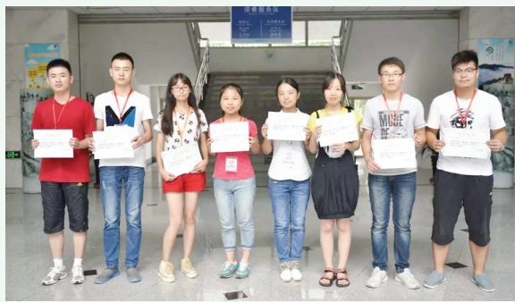
2015年暑期优秀志愿者合影

志愿者是在不为任何物质报酬的情况下,能够主动承担社会责任而不获取报酬,奉献个人时间和行动的人。志愿者的精神是:奉献、友爱、互助、进步。青年志愿者活动使年轻人们获得一个深入接触社会实际、真实了解与认识中国国情的极好机会,不仅丰富了他们的生活阅历,还增强了他们的感性认识。强化了年轻人们的社会责任感,对改善社会风气,确立敬业精神起积极作用。