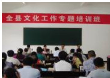
湖名城—庐江名人与合肥城市形象塑造”的人文知识专题讲座，赢得了与会人员的广泛赞誉。