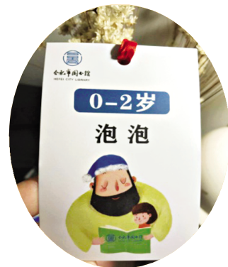
▲ 工作人员贴心设计的书签,暖心!

最后,衷心地感谢合肥市图书馆的工作人员在这21天的辛勤付出和悉心陪伴,你们辛苦了!希望第六季活动能够继续参加!期待合肥市图书馆后续更多精彩的活动!