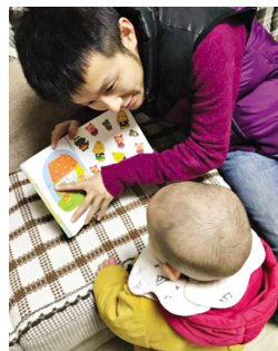
▲ 抛弃手机的爸爸主动带泡泡读绘本啦