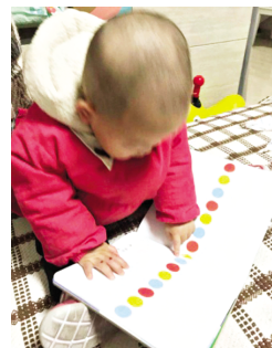
▲ 每日晚饭后,沙发的小拐角,固定的伴读亲子时光